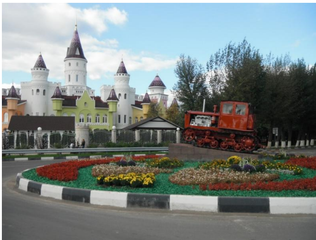
Рис. 5. «Замок детства» – детский сад, построенный за счет финансирования совхоза им. Ленина

Еще одним примером проявления социальной ответственности агробизнеса в решении вопросов развития территории является строительство современного детского сада совхозом им. Ленина в Подмосковье. Хозяйство затратило 260 миллионов рублей на строительство дошкольного образовательного учреждения площадью 6000 кв. метров, обеспечив возведение здания полностью за свой счет. В детский сад, отличающийся с положительной стороны необычным дизайном, за который он получил название «Замок детства», ходят не только дети сотрудников совхоза, но и обычные «очередники», проживающие рядом с предприятием (рис. 5).