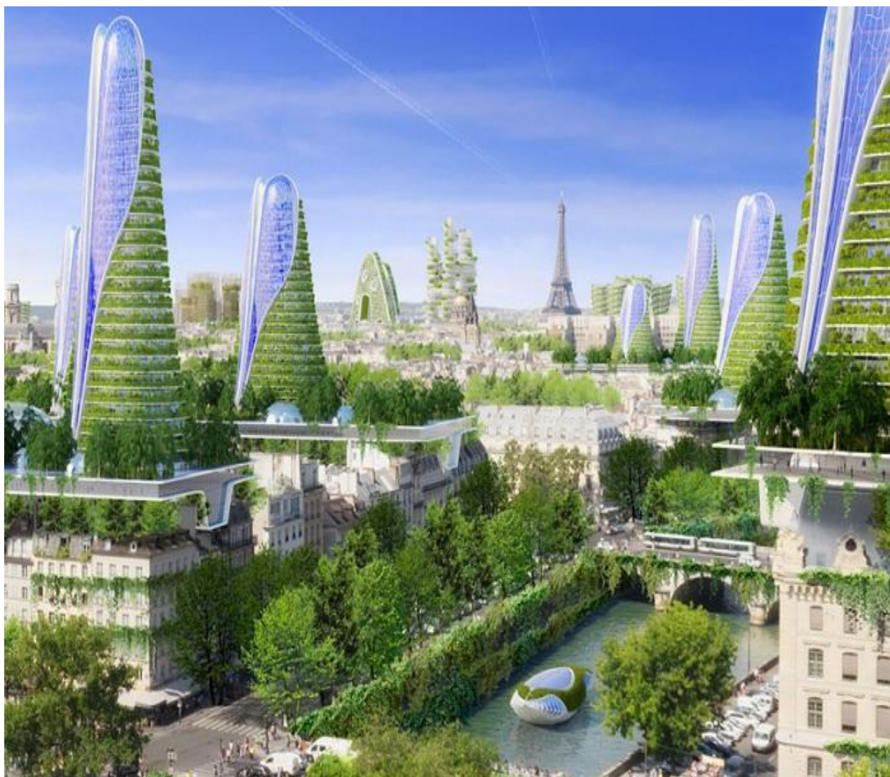
Рис. 1. 2050 Paris Smart City

Интересной практикой государственно-частного социального инвестирования является принятое решение во Франции (в 2016 году). Городские власти Парижа планируют снизить уровень выбросов углекислого газа в атмосферу на 75 %, но не за счет запретов, а посредством вложений. Совместно с архитектурной фирмой Vincent Callebaut Architectures был презентован масштабный проект под названием «2050 Paris Smart City» с различными экологическими характеристиками. Его концепцию можно увидеть на рисунке 1.