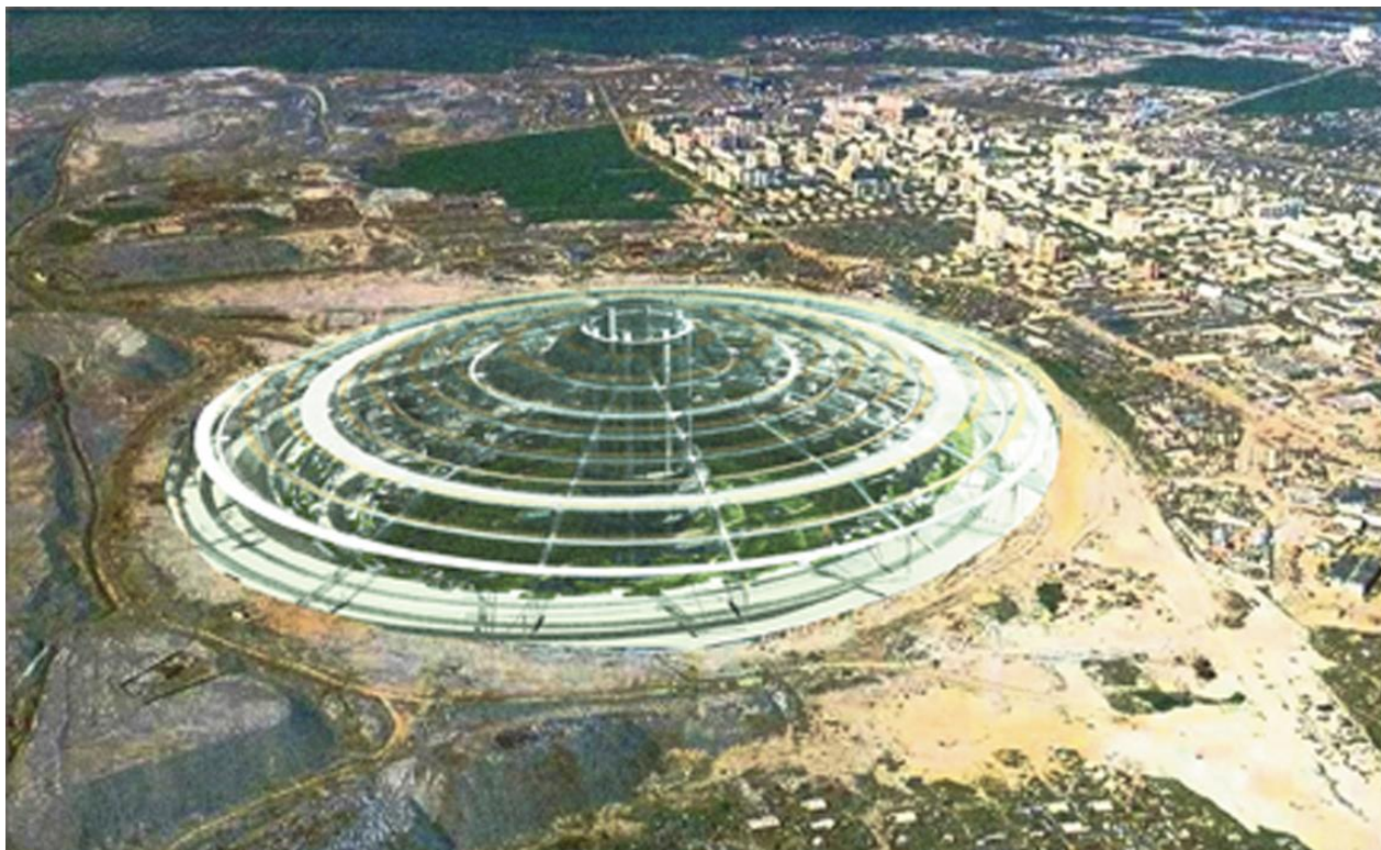
Рис. 4. Проект Eco-city 2020 в г. Мирный (вид сверху)