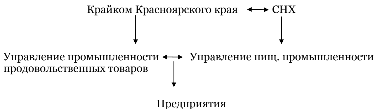
Рис. 3. Схема управления пивобезалкогольной промышленностью и виноделием Красноярского края в 1957–1962 гг.

Первый год в рамках новой системы управления ознаменовался запуском в производство нового сорта пива, а именно темного «Бархатного» [5, с. 61]. Вместе с этим вновь возникла уже ставшая хронической проблема всей пищевой промышленности Красноярского края – перебои с поставкой сахара [5, с. 4]. Дефицит был вызван тем, что данное популярное сырье в крае не производилось. Практически весь сахар здесь был привозным из других совнархозов страны. А с учетом того, что нужду в нем испытывали абсолютно все СНХ, то Красноярск, находившийся в отдалении от основных сахаропроизводящих районов, часто стоял в конце очереди поставок.