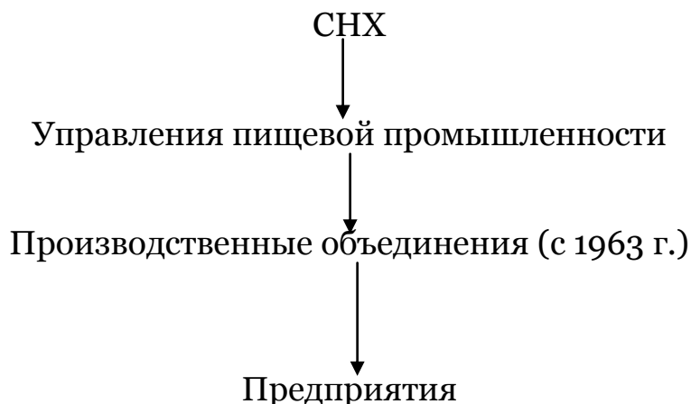
Рис. 4. Система управления пивобезалкогольной промышленности и виноделия 1962–1966 гг.

Уже в рамках управления пищевой промышленности Красноярского совнархоза в 1963 г. произошла очередная реорганизация системы управления. Было проведено создание производственных объединений-фирм, которые объединяли все предприятия пищевой промышленности в рамках одного города. Это позволяло не только сократить управленческий аппарат, но и давало возможность проводить более гибкую политику по снабжению местного населения продуктами питания. Предприятия пивоварения Красноярского экономического района вошли в состав Канского, Ачинского, Минусинского и Хакасского пищевых объединений. Красноярские винзаводы и Красноярский пивоваренный завод вошли в состав Красноярского винзавода и Красноярского бродильно-водочного завода (рис. 4) [12, с. 71].