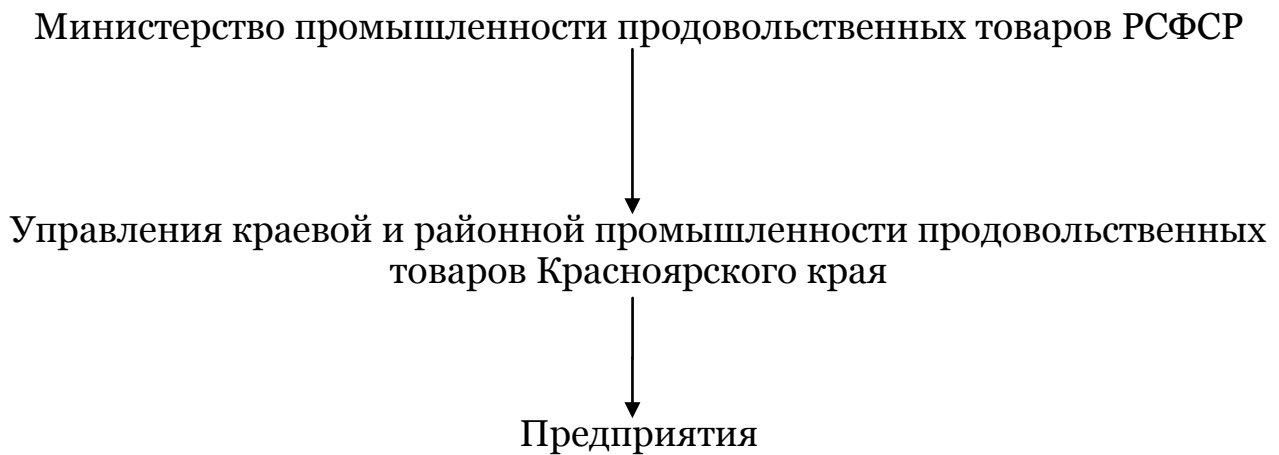
Рис. 2. Система управления пивобезалкогольной промышленностью и виноделия Красноярского края 1953–1957 гг.

Существовавшая в 1953–1957 гг. система управления пивобезалкогольной и пивоваренной промышленности представлена на рисунке 2.