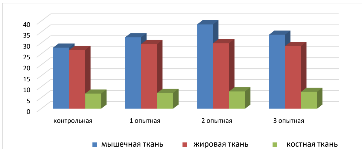
Рис. 2. Морфологический состав туш подопытных свиней, кг