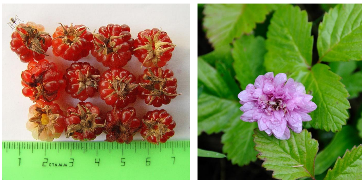
Рис. 1. Княженика: а – зрелые плоды; б – цветение махровой формы

Княженика арктическая – Rubus arcticus L. (сем. Rosaceae) – евразийско-североамериканский арктобореальный вид. В России княженика произрастает на севере и северо-востоке европейской части России, на Урале, в Сибири, на Дальнем Востоке. На северо-востоке России растет на луговинах, в пойменных ивняках, нарушенных местообитаниях, окраинах болот, вырубках и гарях, по долинам рек заходит в тундровую зону. В тундре обильно цветет, но плодоносит редко, встречается обычно единичными экземплярами или небольшими группами. Это небольшое растение высотой до 25 см, с длинными шнуровидными корнями. Цветки княженики обоеполые, диаметром от 1 до 3,7 см, имеют 7–9 ярко-розово-алых лепестков и 5–7 чашелистиков. Опыляются насекомыми. Плод княженики – сборная костянка со средней массой 1–2 г. Зрелые плоды малиново-красные (рис. 1), с сильным приятным ароматом [3]. Растение относится к гемикриптофитам, основной способ размножения – вегетативный. Почки возобновления расположены у поверхности почвы, часто прикрыты мхом или лесной подстилкой.