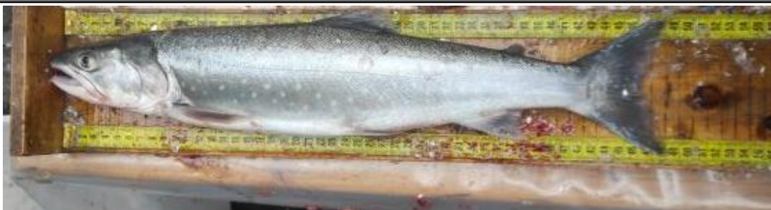
Рис. 1. Гольец Дрягина

Как отмечалось выше, среди гольцов отмечается много видов и форм, что требует идентификации выловленных рыб при внедрении в аквакультуру [3].