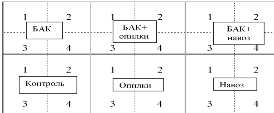
Рис. 1. Схема закладки эксперимента (цифрами обозначены посевы травянистых растений: 1 – горчица; 2 – клевер красный; 3 – газонная травосмесь (мятлик луговой, овсяница красная); 4 – мелисса)

Закладка эксперимента по микробиологической рекультивации техногенных поверхностных образований (ТПО) проводилась на двух пятилетних отвалах с нанесением плодородного слоя почвы (ПСП) (реплантозем) и без (литострат) [6]. Верхний 20 см слой ТПО предварительно взрыхляли фрезой, затем размечали участки (2×2 м) с разными вариантами эксперимента (рис. 1).