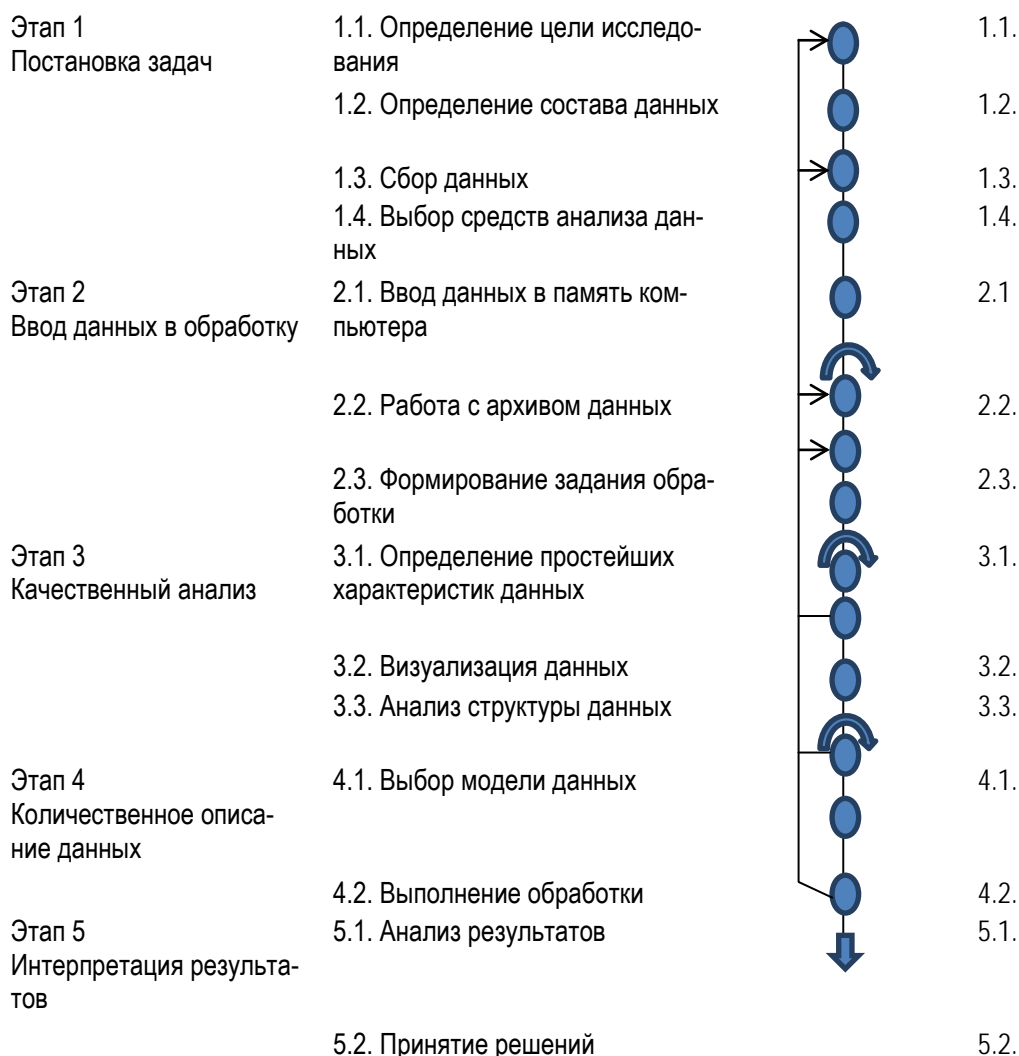
Рис. 2. Основные типы решения задачи анализа данных и их взаимосвязи

При построении таких последовательностей необходимо уделять большое значение сбору данных, приемам накопления однородных данных, схемам классификации и группировки однородных данных, планам для выделения источников различного типа неоднородностей. Перечисленные приемы и методы развиваются в различных аспектах теории решающих функций, методов обработки данных, планирования эксперимента. Неформализованным в анализе данных остается выбор критерия для отбора в некотором смысле наилучшей последовательности процедур, раскрывающих структуру данных. Следует отметить, что никакие методы и программы обработки данных не помогут дилетанту извлечь из данных (и хороших, и плохих) информацию. Определяющим фактором всегда является профессионализм исследователей.