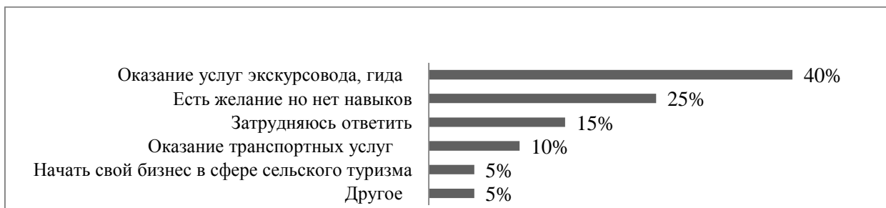
Рис. 3. Ответы респондентов на вопрос «Что вы можете сделать для развития сельского туризма в Ужурском районе?»

По результатам анкетирования готовы начать свой бизнес в сфере сельского туризма 5 % опрошенных, половина респондентов готовы предоставить свои услуги. Почти 25 % опрошенных жителей хотели бы получить профессиональные знания в области туризма (рис. 3).