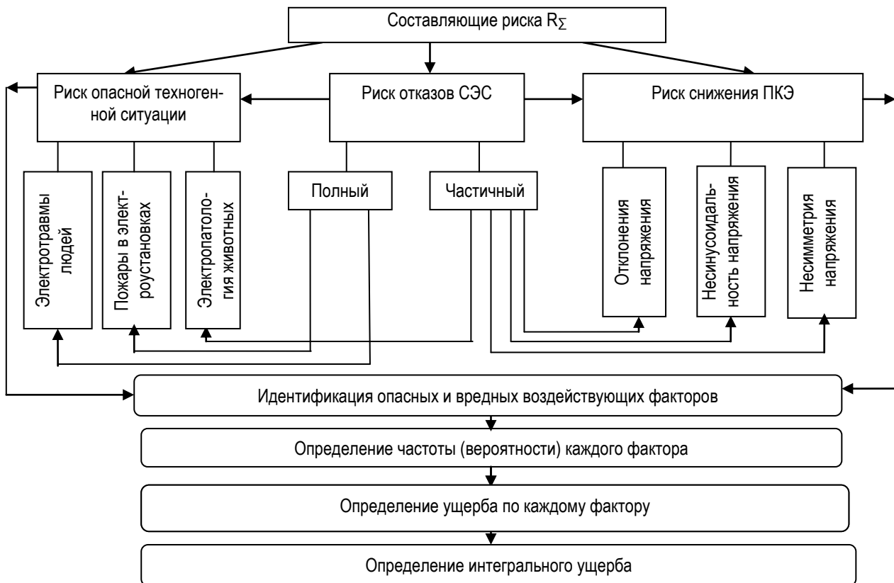
Рис. 4. Методология оценки интегрального риска ЭУ

Выводы. Как было отмечено выше, все риски могут быть определены статистическим либо вероятностным (с помощью математического моделирования) методом. Последующие этапы, связанные с сопоставлением полученных расчетных значений интегрального риска с приемлемым, установленным соответствующими нормативами, наглядно иллюстрируются на рисунке 4.