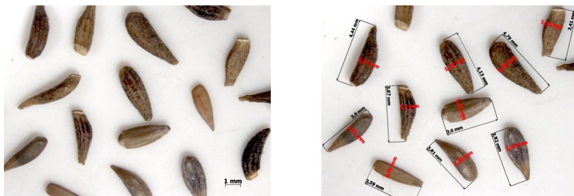
Рис. 2. Гацания блестящая ( Gazania x splendens Angl.). Семейство Астровые (здесь и далее: слева – форма, справа – размеры)

НГАУ, у всех образцов, изучаемых на практических занятиях, сначала были сделаны фотографии, позволяющие сделать описание формы, цвета, структуры семенной кожуры. Далее на отдельных фотографиях были указаны морфометрические параметры, позволяющие обучающимся использовать статистическую обработку.