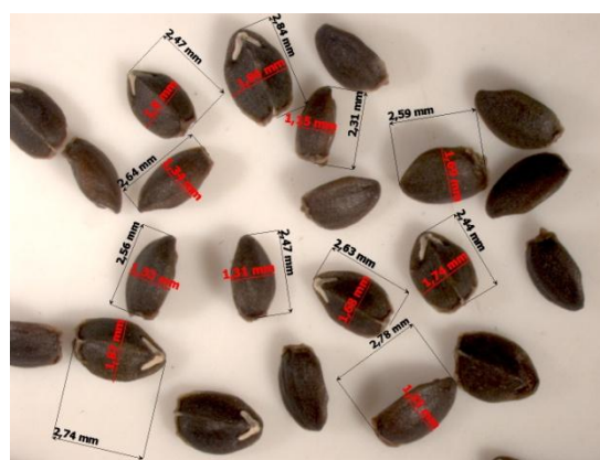
Рис. 4. Змееголовник молдавский ( Dracoscephalum moldavica L.). Семейство Яснотковые

Гацанию блестящую можно выращивать весенним посевом в грунт, но в суровом климате предпочтительно выращивание рассады. При посеве в теплице в середине апреля цветение начинается в середине июля и продолжается до глубокой осени, однако семена удастся получить только в теплое, сухое лето.