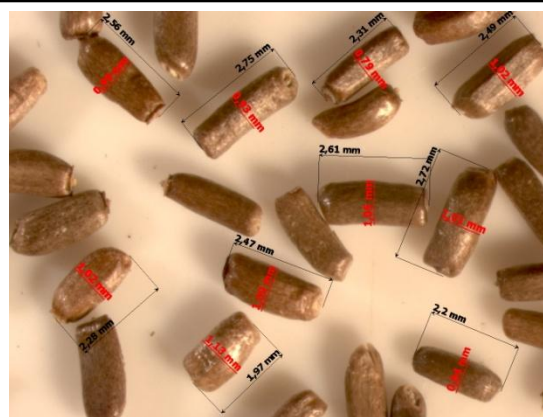
Рис. 3. Гелиптерум Менглеса ( Helipterum manglesii (Lindl.) Baill.). Семейство Астровые